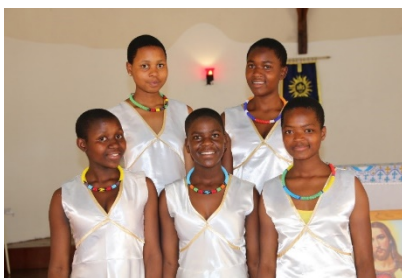
Fünf Sängerinnen: Der Chor in Minimalbesetzung.