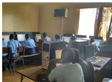
Einer von zwei Computerräumen in der alten Verwaltung.