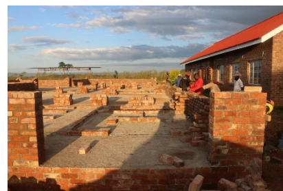
Im Bau: das neue Gebäude für Computerunterricht und –recherche.