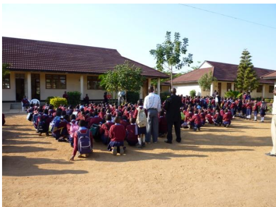
Morgentliche Versammlung vor Schulstart

In diesem Jahr steige ich mit einem Teil ‚meiner‘ Schüler von Klasse 2 in Klasse 3 auf und