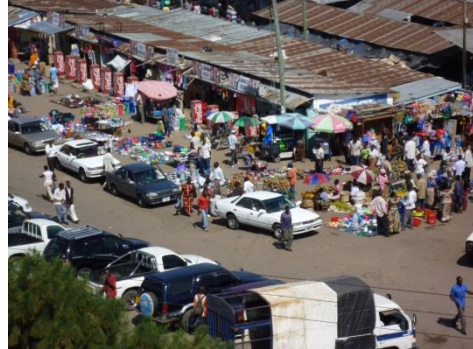
Markt in Mwanza