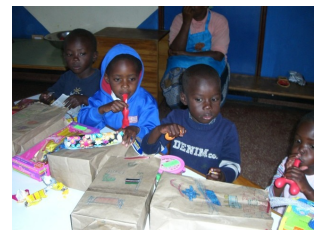
...und nach der Bescherung