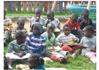
Festessen am 20.Dezember

Vier Kinder sind nun neu in die erste Klasse unserer eignen kleinen NEST-Schule gekommen, sodass momentan 17 Kinder die Schule und 19 Kinder den Kindergarten besuchen. Ein Plan für das neue Jahr ist den Kindergarten für Kinder armer Familien