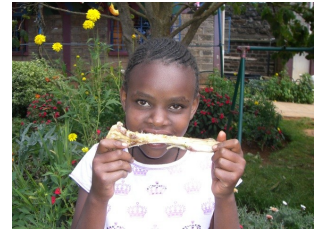
es war einmal eine Ziege...