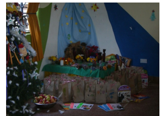
Vor der Bescherung...