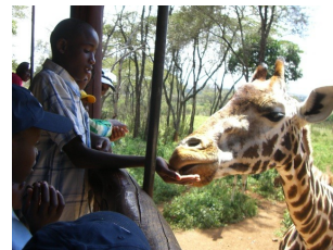
Ausflug der älteren Kinder zum Giraffecenter

Unsere älteren Kinder lieben es zu skaten, doch leider haben wir momentan nur zwei Paar. Meine Schwester wird Mitte Februar nach Kenia kommen und könnte diese als Spenden für das NEST mitnehmen. Rückmeldung bitte bei mir per Mail.